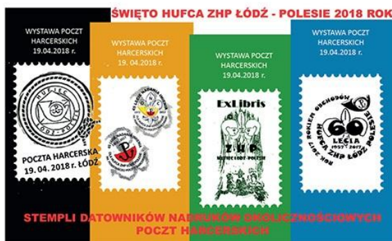
STEMPLI DATOWNIKÓW NADRUKÓW OKOLICZNOŚCIOWYCH POCTZ HARCERSKICH

datownikiem okolicznościowym stosowanym w tym samym Urzędzie Pocztowym w dniu 19.04.2018 roku.