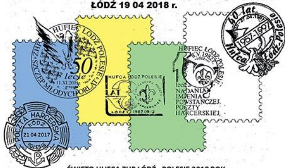
ŚWIĘTO HUFCA ZHP ŁÓDŹ - POLESIE 2018 ROK

datownikiem okolicznościowym stosowanym w tym samym Urzędzie Pocztowym w dniu 19.04.2018 roku.